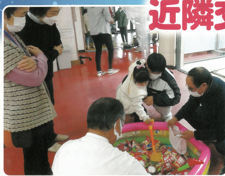
『民生委員のサポートでお菓子づくりを楽しむ親子』

編集・発行/社会福祉法人 五所川原市社会福祉協議会 電話 0173-34-3494 FAX 0173-35-5855 〒037-0033 五所川原市字鎌谷町502-5 URL http://gccsw.net/ E-mail owner@gccsw.net ■金木支所・電話 0173-53-2241 ■市浦支所・電話 0173-62-3285