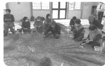
「ご利益も特別だ!」とにぎやかな会話。

金木地区の5地域ごとに、しめ縄づくりを楽しみながら住民のつながりを深めました。子ども達の参加もあり、熟練の編み技に驚き、教わりながらオンリーワンの作品を仕上げ、世代間交流も広がりました。