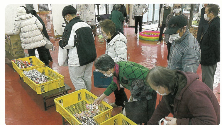
『食品を選び持ち帰るこども宅食おすそわけ便を疑似体験』