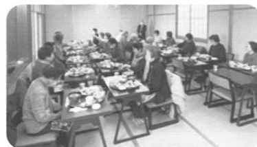
「健康だばいいごとあるもんだな」と昼食を味わう参加者。

ひとり暮らし高齢者13名と民生委員、なんでもかだるべし〜うらの皆さんにもお手伝いいただき、黒石方面に日帰り旅にバスでお出かけしました。「久しぶりのお出かけだったけど、思いきって参加して良かった。」「自分一人では出かけることも不安だったから参加して良かった」などの声も聴け、参加人数は少なかったのですが、検温・消毒・マスク着用が必須の世の中、久しぶりの再会に笑顔があふれていました。