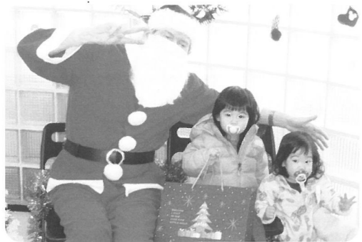
「時間が経つと大きく手を振る子も」

サンタさんがプレゼントやケーキを抱えて「メリークリスマス!」と現れると「わあ、サンタさんだあ!」と目を輝かせる子やびっくりして固まってしまう子も…。名前を呼ばれて笑顔が戻り、にっこりハイチーズ♪ 夕方には、各家庭へのお届けにサンタが出向きました。