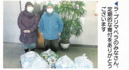
▲「一年間、みんなで集めました!来年も頑張ります!」米小学校JRC委員会のみなさん