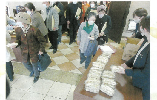
▲非常用保存食「アルファ米」五目ごはんを試食用にお渡し。白ごはんやわかめご飯など種類も増える様子。

「言葉ひとつで人とのつながりは豊かになる。言葉掛け上手になり、皆さんも地域の課題解決の仕掛け人になりましょう」と呼びかけました。 また、五所川原市防災管理課中川係長は、昨年8月の大雨災害や多発する自然災害を報告。「住民が構築する地域の防災力が、いざという時に絶大な力となる。」と公助と自助・共助の大切さを呼びかけました。 参加した男性は、「地域を愛する気持ちを高め、仲間を集める声掛けの大事さが伝わった。こうした活動が一杯に広がってほしい」と期待を述べていました。