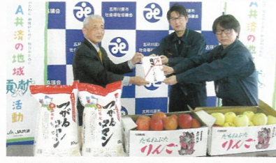
▲「子育て世帯に分けてください」と、ごしよつがる農協から米1,000kg、りんご1,000kgの寄付をいただきました