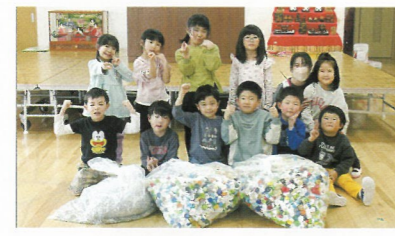
▲集めたキャップ等を前にして元気にポーズ! 認定こども園なおみ園の園児たち